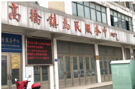
高桥镇为民服务中心,农服中心就在此办公