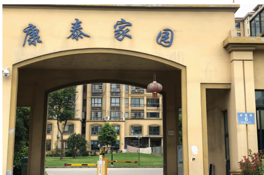
已经建好的康泰家园安置小区