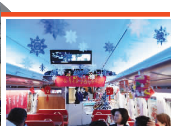
冬奥专线多功能车厢