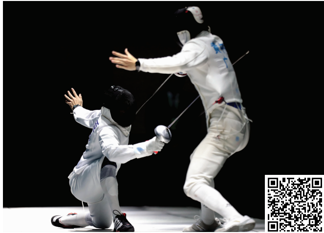
男子重剑团体决赛现场 扫码看视频

在女子佩剑团体方面,由国家队队员庄晨艺、傅颖、杨恒郁、钱佳睿组成的江苏队,与由张佳