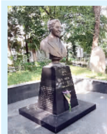
位于南师大随园校区的魏特琳雕像