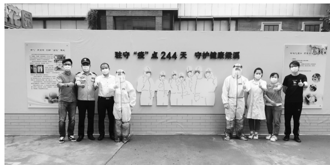
集中医学观察点内工作场景

同时,美湖文化街不断提档升级,打造文化特质魅力,“吴韵美湖”文化节的举办,也点亮了百姓文化生活,营造辖区与邻为善、与邻为伴的良好风气。今年,“吴韵美湖”文化节从9月26日至10月8日,美湖社区将每天为大家呈现一大活动,搭戏台、游园会、网红打卡……让国庆、中秋焕发新活力、新光芒。