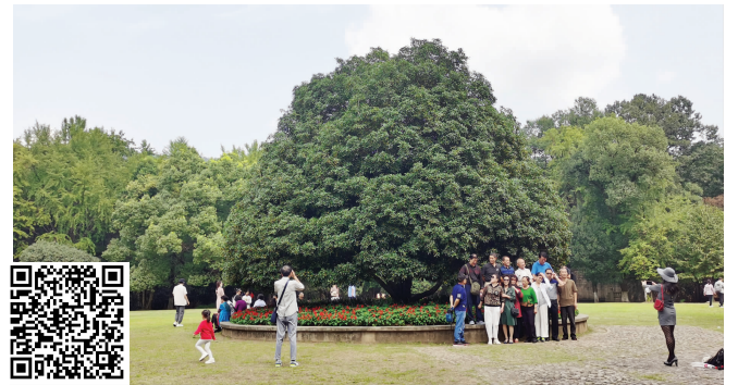
扫码看视频 灵谷景区“金陵桂花王”

快报讯(记者 蔡梦莹)秋天的凉意扑面而来,又到了南京人一年一度的赏桂时节了。9月26日,2020年第二十一届南京灵谷桂花节开幕。现代快报记者了解到,灵谷景区的“金陵桂花王”已经绽放,在即将到来的国庆长假中,将迎来最佳品赏赏桂期。