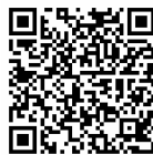
扫码查看 公交线路 调整详情

另外,根据公安交管部门交通组织方案,9月29日19:00—23:00期间、10月1日至8日19:30—23:00期间,公交29路、44路、304路、65路、9路、95路等6条线路走向临时调整。