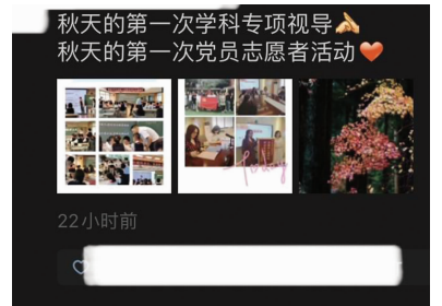
网友解锁秋天的其他第一