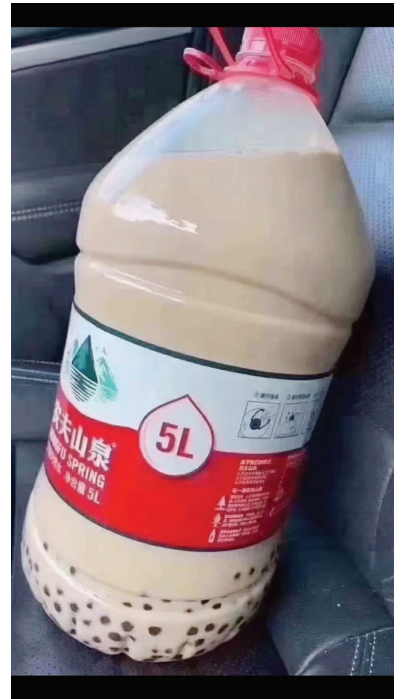
放张奶茶的图,网友秀恩爱的方式就这么简单

过了秋分,白昼渐短,黑夜渐长。大概也正是因为这样的时间节点,生活和记忆都有了特征。尽管南京还没有官宣入秋,但在这个明显区别于盛夏的时间里,有太多的第一次可以解锁。