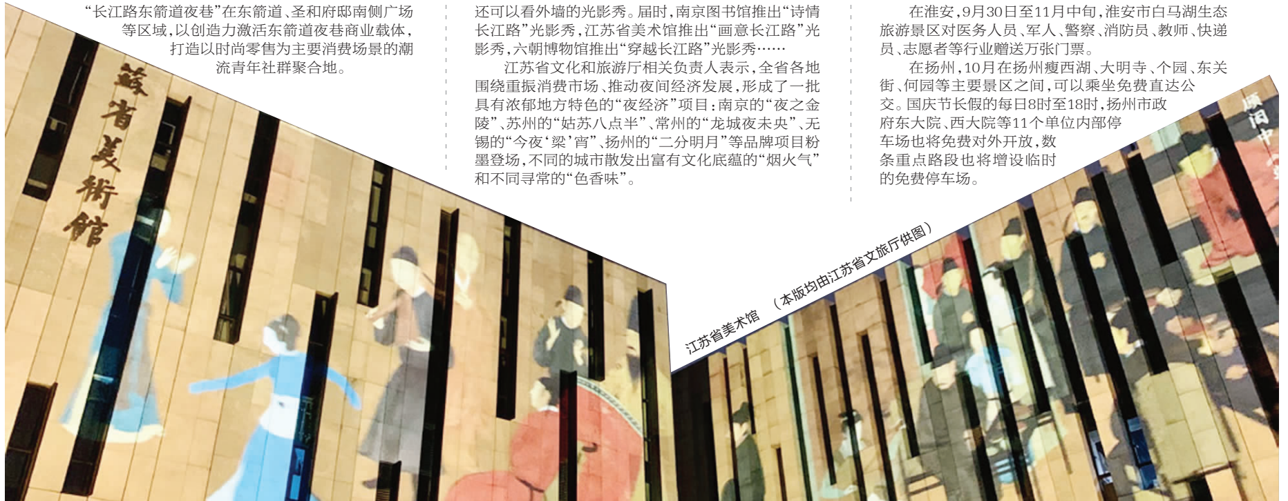
江苏省美术馆

在扬州,10月在扬州瘦西湖、大明寺、个园、东关街、何园等主要景区之间,可以乘坐免费直达公交。国庆节长假的每日8时至18时,扬州市政府东大院、西大院等11个单位内部停车场也将免费对外开放,数条重点路段也将增设临时的免费停车场。