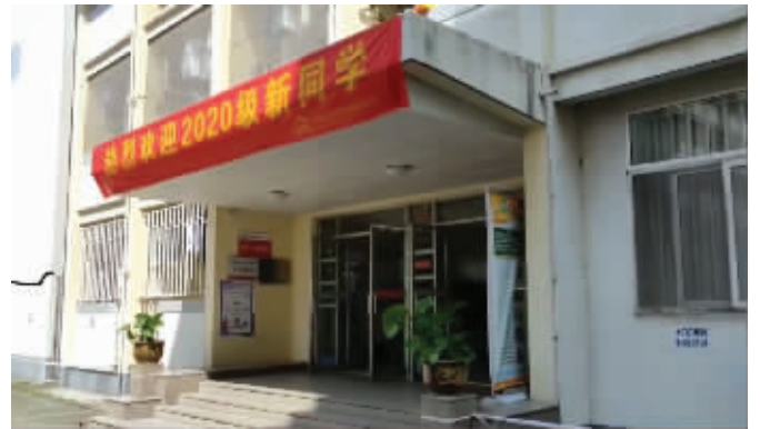
死者生前所在的宿舍楼

昨天中午,南京师范大学一位负责宣传的工作人员告诉记者,校方对此事感到非常悲痛,目前警方正在调查此事,学校和学生家属都在等待事件的具体调查结果。