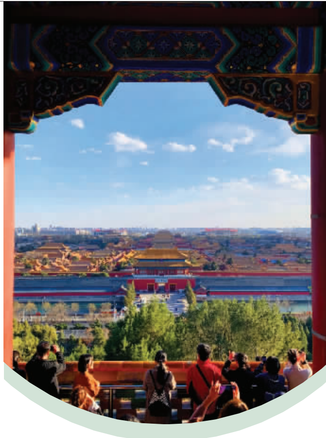
从景山眺望北京故宫