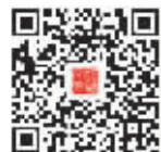
扫码关注 江苏文脉公众号

天上紫微垣,地上紫禁城。为庆祝600岁大寿,北京故宫用一场大展来讲述前世今生。“丹宸永固——紫禁城建成六百年”在故宫博物院午门展厅展出。这场紫禁城建成600年的大展,除了故宫博物院自家的文物外,还特邀南京博物院的23件文物“进宫”同台亮相。