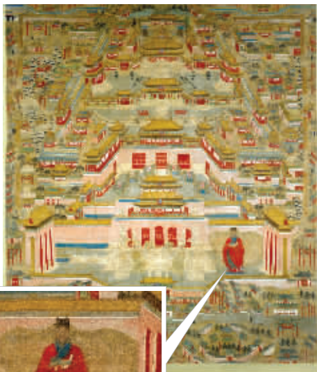
▲《明无款北京宫城图轴》高清图

1406年,永乐皇帝朱棣下决心迁都,当初营造南京皇城的能工巧匠们也就成为建设北京皇城的不二人选。于是蒯思明带着儿子蒯福、孙子蒯祥一起来到北京,延续蒯家军神话。