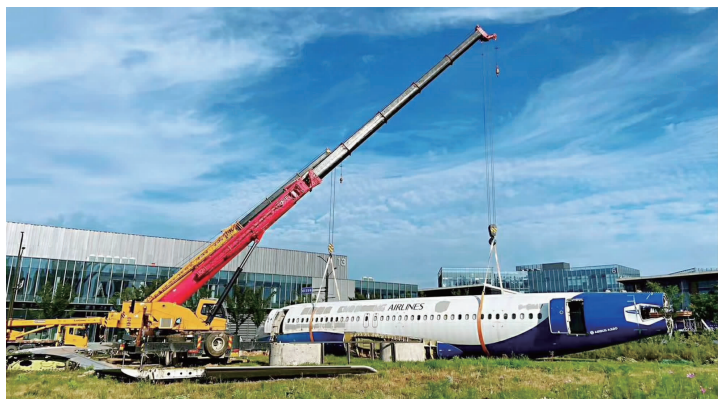
退役飞机吊装过程