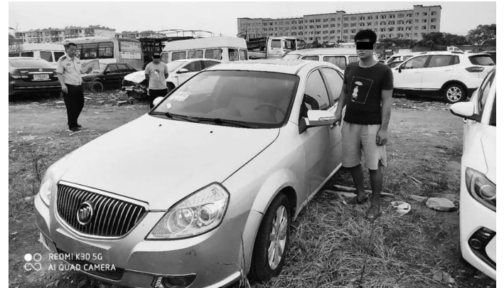
小伙组装的轿车

快报讯(记者 孙旭晖)日前,宿迁市泗洪县车管所里,交警在给一辆来过户的车辆进行检查时发现,这辆车堪称“缝合怪”:车身是在网上拍卖来的一辆报废车,车架、底盘等配件也都是通过网购来的。车主把这些零件收集起来以后,自己在家手工拼成了现在这辆车。