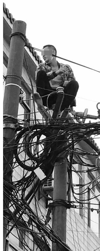
小伙爬电线杆轻生