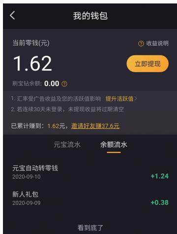
记者刷视频获得1.24万元宝,兑换成零钱1.24元,还有0.38元新人礼包

在评论留言中可以看出,很多人是被广告中的轻松赚钱吸引,但实际使用后并没有那么轻松,不少人说一天下来只能刷一两块钱。