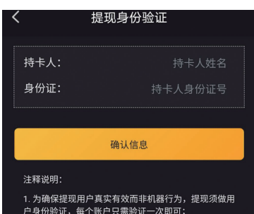
提现身份验证需输入姓名和身份证号