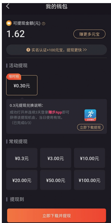
提现常规提现和活动提现两种,选择活动提现需下载相关App并完成“任务”