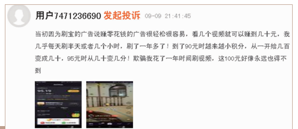
网友在投诉平台投诉“刷宝”