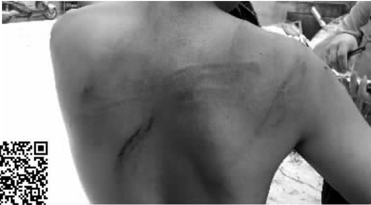
男子后背被打出道道伤痕 通讯员供图(扫码看视频)

“喂!110吗?我被老婆打了,你们快来吧!”近日,泰州靖江公安新桥派出所民警接到一起“不寻常”的警情,一男子哭诉自己被老婆家暴。民警到现场了解前因后果后,真相让人大跌眼镜。