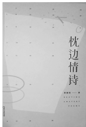
2020年6月 长江文艺出版社 黄建国 《枕边情诗》

灵感有钥匙，但不在上帝的手里。诗人智慧，是寻找和使用钥匙的人。只是生活过于喧嚣，心性若被杂念填满得枝枝叉叉，与灵感情投意合的灵性易于丢失，静空无尘的禅悟空间就真的空空如也。