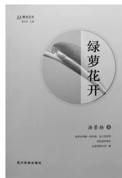
2020年6月 四川民族出版社 汤景扬 《绿萝花开》

绿萝的花季在春天里，它的花语是“守望幸福”。在春天里守望幸福，确实是一件十分令人幸福的事。