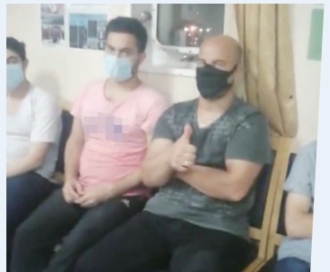
被救助的国际难民