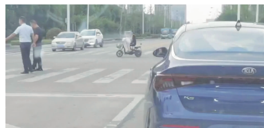
搀扶过马路 视频截图 扫码看视频