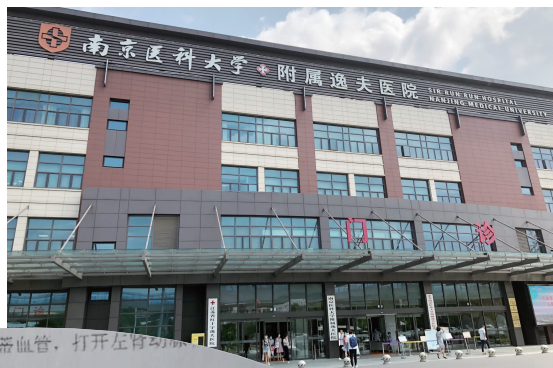
南医大附属逸夫医院