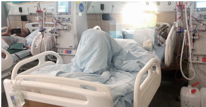
患者目前仍在南医大附属逸夫医院做血透