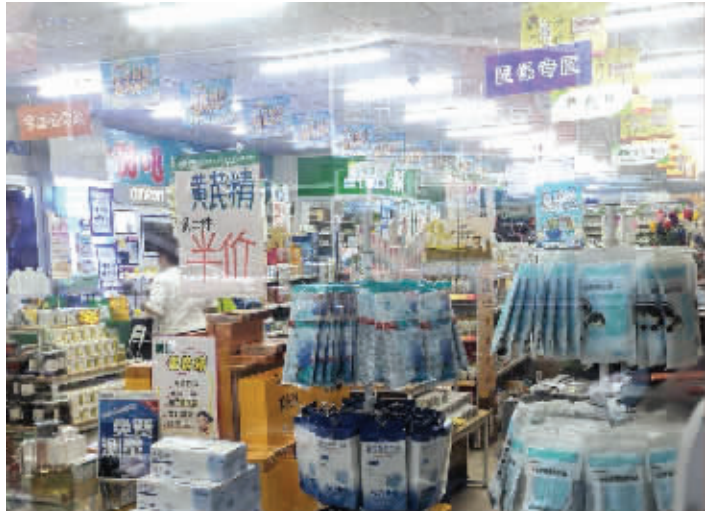
记者探访,药店将医保用药和非医保用药做了明确区分