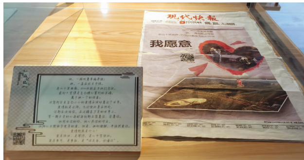
爱情博物馆里有一张2018年4月30日的头版报纸