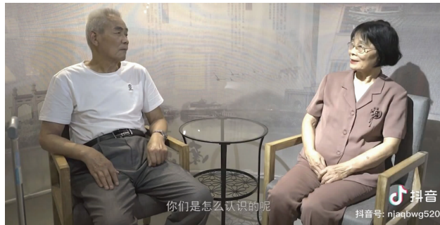
护士奶奶和老伴体验5分钟对视