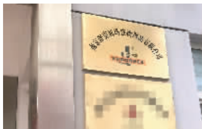
南京舒克贝塔宠物用品有限公司