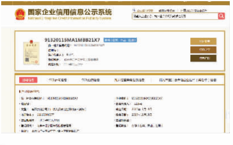
国家企业信用信息公示系统显示的该公司信息