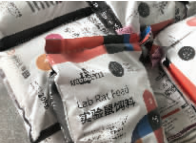
该公司生产的实验鼠饲料包装袋印有舒克贝塔商标