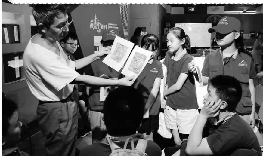
王馆长点评小记者制作的藏书票

藏书票是一种微型版画艺术,外形小巧且蕴含着深厚的艺术、美学与文化价值,被誉为“版画珍珠”“纸上宝石”“书中蝴蝶”。它有着较长的发展历史,不仅仅是美化和装饰书籍的一个重要元素,同时也体现出人们对于藏书的珍视和喜爱,更是具有书籍特征与社会价值的历史文化载体。8月7日,常州市博爱小学的部分快报记者走进武进藏书票博物馆,开展藏书票参观和制作活动。