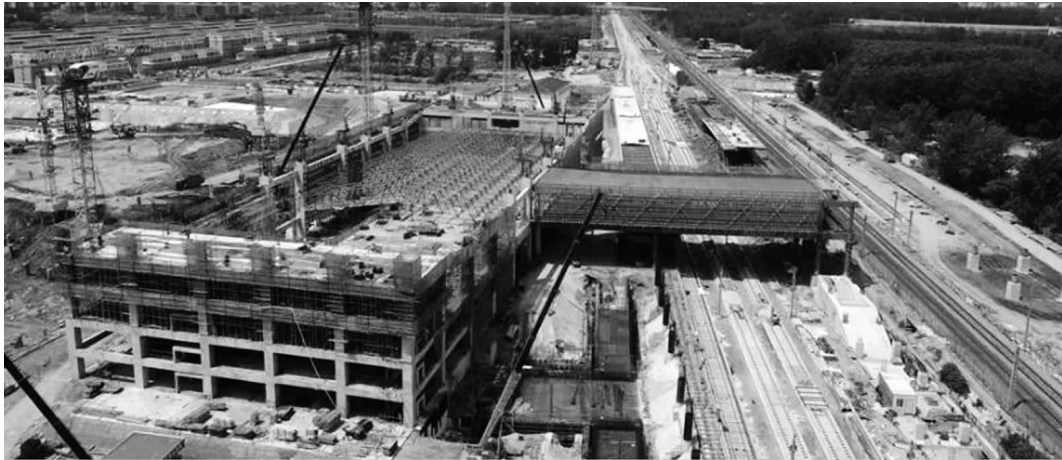
邳州东站站房主体工程已经完工

近日,连徐高铁轨道铺设,正式进入邳州境内,与此同时,邳州东站的建设也在紧锣密鼓地推进。目前,邳州东站站房主体工程已经完工,为连徐高铁今年年底建成通车打下了坚实基础。