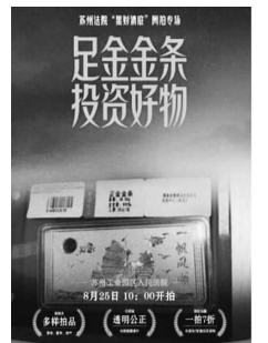
部分拍品网络截图

快报讯(记者 何洁)快来“捡漏”!戒指3.5元起拍,还有一批名包首饰豪车,统统低价起拍……现代快报记者了解到,8月25日,苏州中级人民法院将组织全市法院“黑财清底”网拍专场,集中处置一批涉黑涉恶案件财产,专场起拍共计191件拍品。