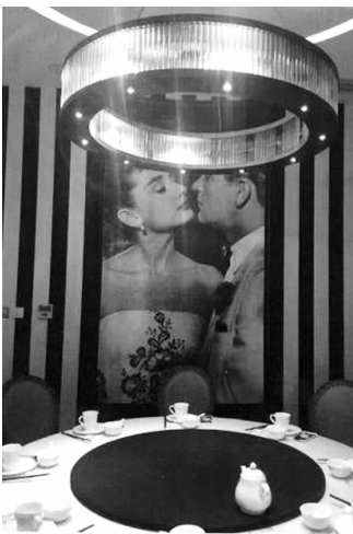
主题餐厅内饰

苏州园区法院经审理认为,餐饮公司未经许可,以营利为目的使用奥黛丽·赫本的姓名和肖像,不仅一定程度上损害了原告对其母亲的情感利益,还直接损害了原告应当享有的经济利益,原告要求餐饮公司停止使用奥黛丽·赫本的姓名和肖像并赔礼道歉的请求,符合法律规定。综合餐饮公司在诉讼中主动停止、未使用侮辱丑化等方式,且赢利并非单纯依靠餐厅名称或内部装饰图片等多种因素,园区法院判决餐饮公司立即停止使用