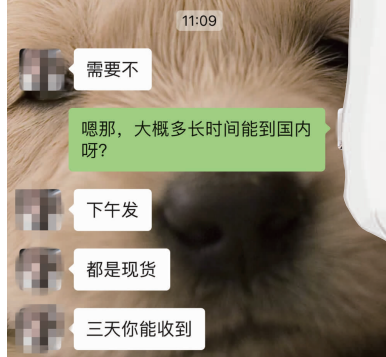
记者与微商的聊天记录 手机截屏

最强版:2700元,(红灰主胶囊28粒,燃脂胶囊全部配齐全)针对常年吃减肥药,体重一直没下降的人,正常可以减20斤左右。