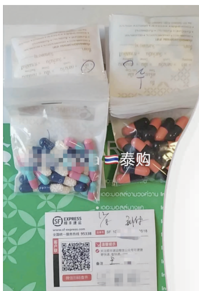
微商售卖DC减肥药广告

超强版:2300元,(蓝白主胶囊28粒,燃脂胶囊全部配齐全)适合服用过多个减肥药,顽固性体质的人,正常可以减15-20斤左右