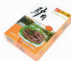
售价:37元/盒 (220克) 2盒起售