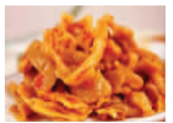
五香和香辣两种口味,3盒起订。 价格:15元/盒(100克×3袋)

地址:洪武北路55号置地广场现代快报社1812室,订购热线:025-96060(江苏省内包邮)