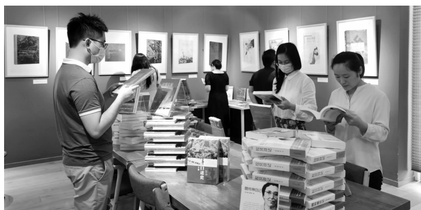
凤凰集团推出抗战胜利75周年主题出版物联展

据凤凰集团出版部相关负责人介绍,此次主题出版物呈现了四个特点:一是展现了中国人民14年的伟大抗