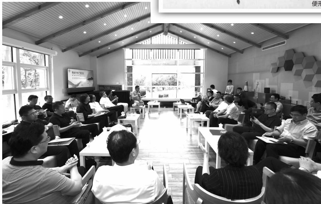
昨天,在紫金文化产业沙龙上,众多大咖掀起“头脑风暴”