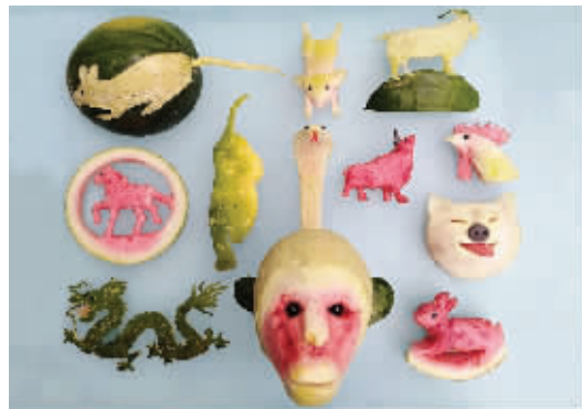
用西瓜雕出的十二生肖作品