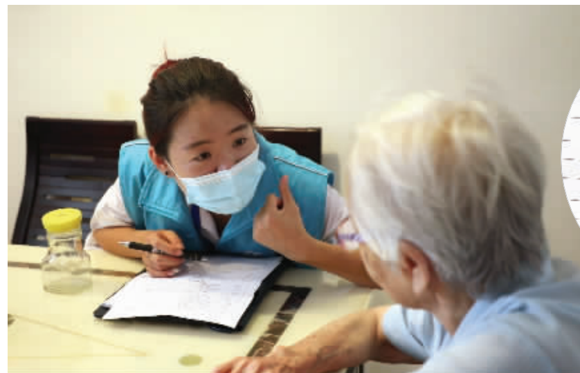
老年人能力评估师上门为居家养老的老年人做评估

江苏省民政厅养老服务处副处长叶翔宇告诉现代快报记者,目前全省60岁及以上老年人口超过1834万人,其中失能、半失能老人有133万,评估的需求还是比较大的。同时,到2022年全省80周岁以上老年人能力综合评估要实现全覆盖。通过老年人能力评估,才能真正掌握老年人各方面的照护需求,合理分配有限的资源,精准制定政策。叶翔宇表示,老年人能力评估师很缺乏,缺口是巨大的。