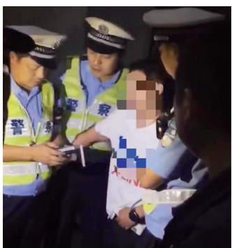
抓获嫌疑人 视频截图