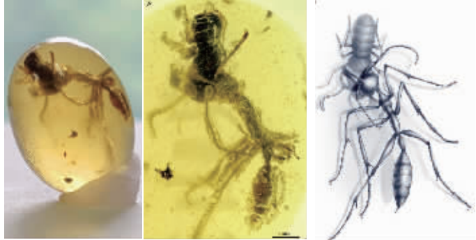
左:琥珀定格独角蚁捕食蟑螂 中:用显微镜看这枚琥珀 右:图片复原捕食瞬间

现代快报+ZAKER南京记者 阿里亚/文