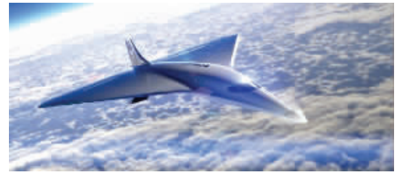
飞机设计图

英国维珍银河公司3日宣布,将与英国罗尔斯罗伊斯公司合作打造超音速商用飞机,飞行时速可达3马赫,即3倍音速。英国《泰晤士报》报道,如果飞机研发成功,今后从英国伦敦飞往美国纽约的航程可能仅需90分钟。