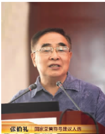
张伯礼 国家荣誉称号建议人选