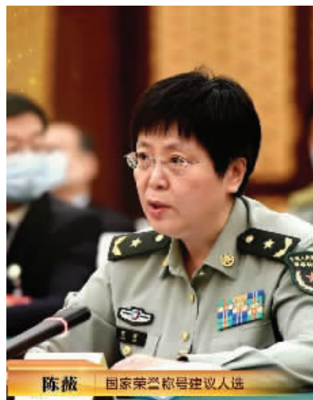
陈薇 国家荣誉称号建议人选