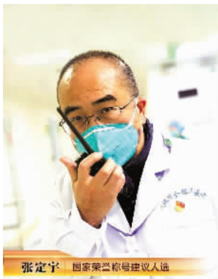
张定宇 国家荣誉称号建议人选