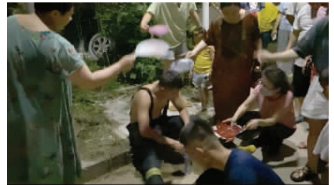
居民为消防员扇扇子降温

快报讯(记者 李伟豪 通讯员 王珍)8月2日晚,徐州市一小区发生火情,消防部门紧急出动灭火。在扑救的过程中,一名消防员热晕倒地。队友帮他脱掉厚厚的消防服,抬到旁边稍事休息。此时,感人的一幕出现了:一位好心女士拿来一瓶矿泉水,给消防员淋水降温,并帮他擦拭脸上的汗水;一群居民聚拢过来,围着这名消防员扇扇子。