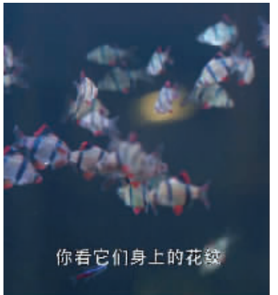
剧中的虎皮鱼 视频截图