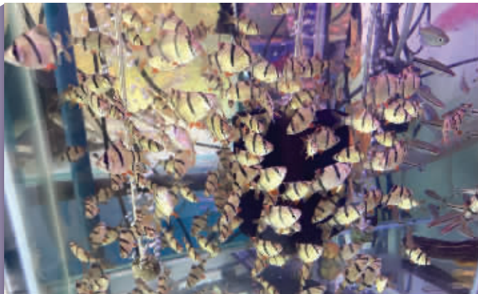
水族馆中的虎皮鱼