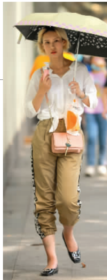
昨天,市民行走在热浪滚滚的南京街头,遮阳伞成为标配