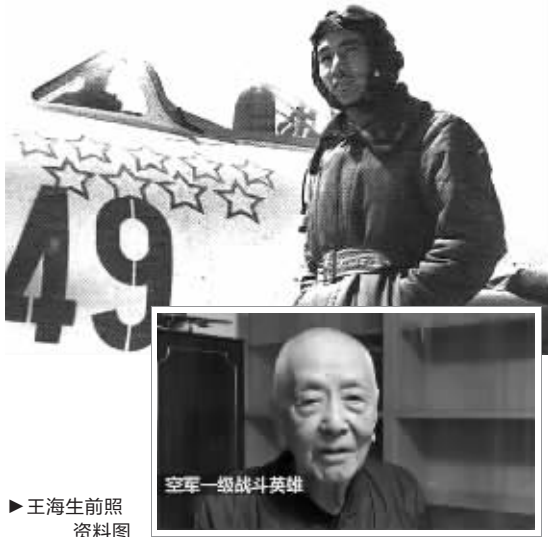
▶王海生前照 资料图

记者从王海将军亲友处获悉,解放军空军原司令员王海上将已于2020年8月2日上午在北京逝世,享年94岁。 公开资料显示,王海,山东威海人,1926年1月生,1944年5月参加革命工作,1945年9月加入中国共产党,1946年6月参军。在抗美援朝空战中,王海共击落击伤敌机9架,先后荣立过二等功、一等功、特等功,被空军授予“一级战斗英雄”称号。他所带领的“王海大队”,与号称“世界王牌”的美国空军激战80余次,击落击伤敌机29架,荣立集体一等功。