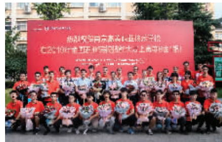
学校在全国职业院校技能大赛中屡获佳绩