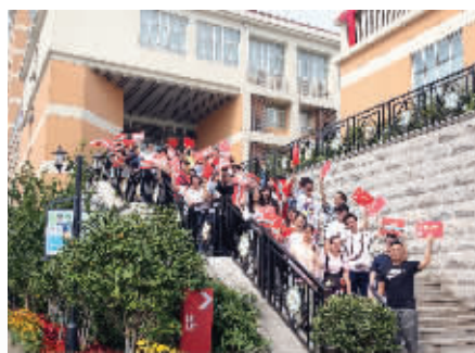
5+2学生喜获本科录取通知书