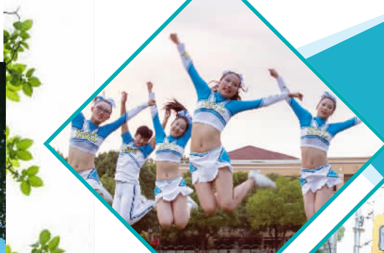
活力四射 的啦啦操队