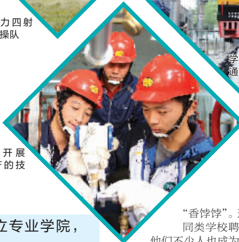
学生开展 贴近生产的技 能培训