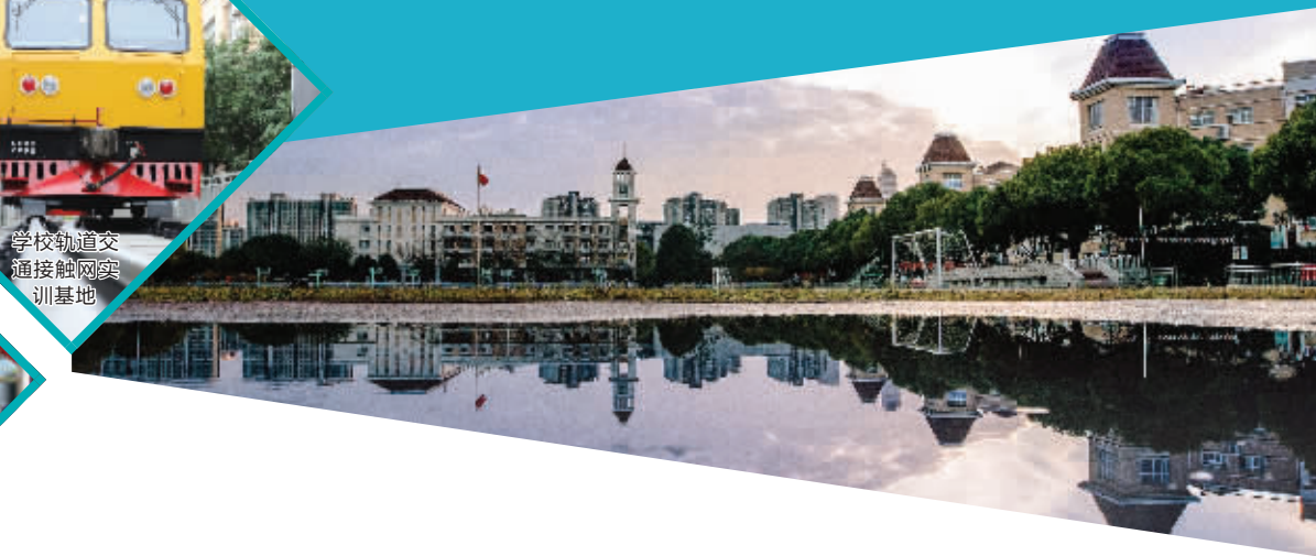
学校轨道交 通接触网实 训基地