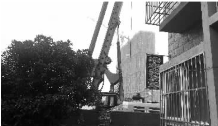
“花样年”施工紧挨泰来苑,原来围墙已经拆除

对此,记者采访了花样年·花好园项目一位由姓负责人。他表示,花样年·花好园的项目规划是按照红线界定范围操作,“当初买