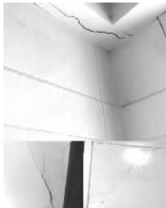
泰来苑住户墙体出现裂缝