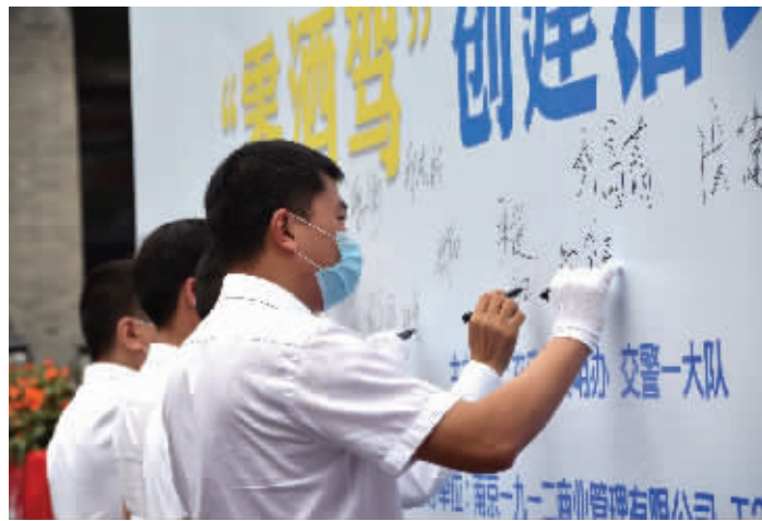
南京交警部门在1912街区举行“零酒驾”创建启动仪式

部分心存侥幸的驾驶人认为,高速公路特别在晚间是交警查处的“真空地带”,南京交警公路防控