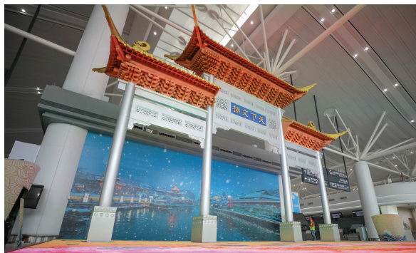
T1航站楼内的“天下文枢”牌坊