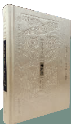
好书推荐 | 《江苏文库·研究编:江苏历代文化名人传·吴敬梓》 陈美林著 江苏人民出版社

这里的“洋糖”,可不是国外进口的糖果,而是精制的白糖。在那时,白糖也是送人倍有面儿的礼物呢!