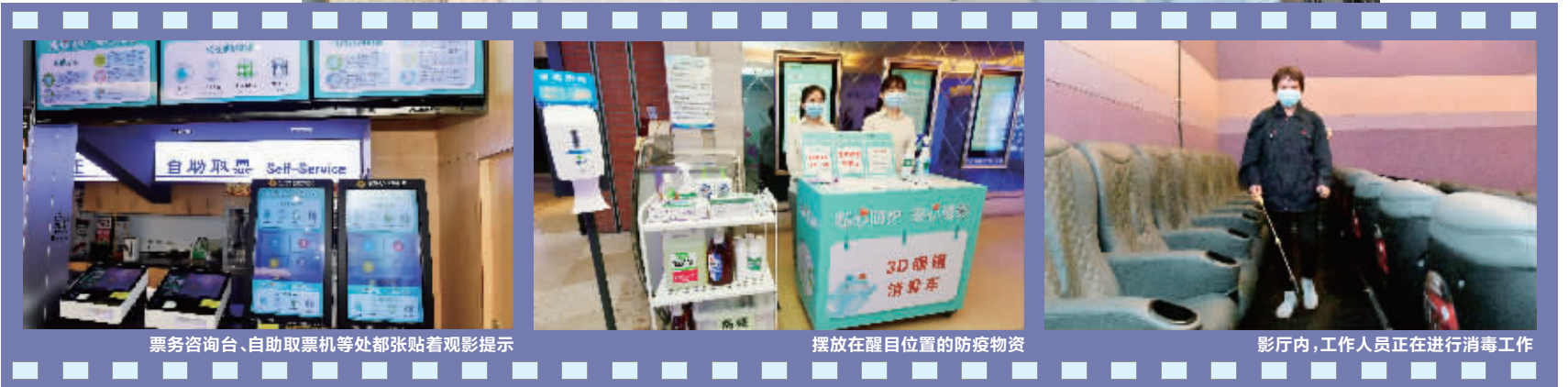
票务咨询台、自助取票机等处都张贴着观影提示