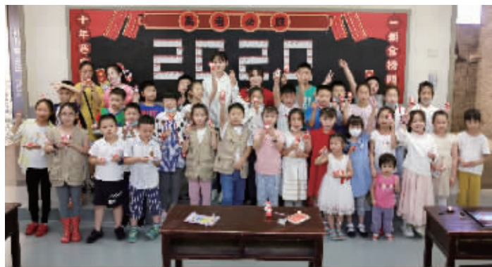
小记者们和捏制的“状元”作品合影