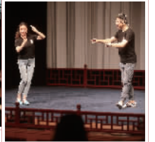
昆剧院“靓仔团”精彩表演