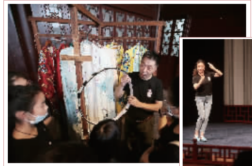
昆曲演员向营员展示服饰道具