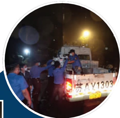
执法人员暂扣非法经营工具