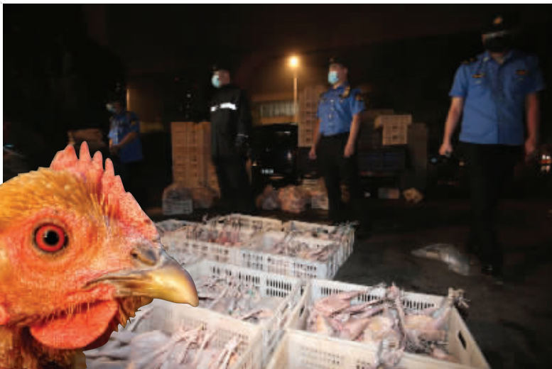
也有不少杀好的鸡在售卖

据悉,沙洲街道和南苑街道的两个城管执法中队将加大对该片区巡查和管理力度,定人定岗,防止反弹。