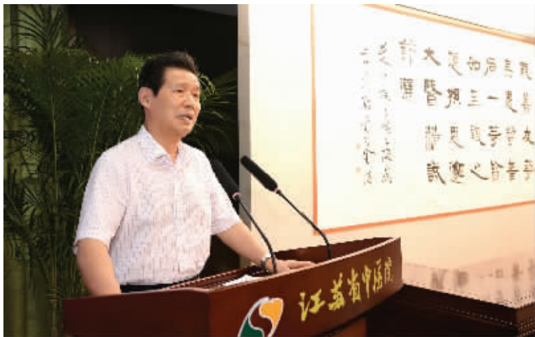
著名书法家言恭达