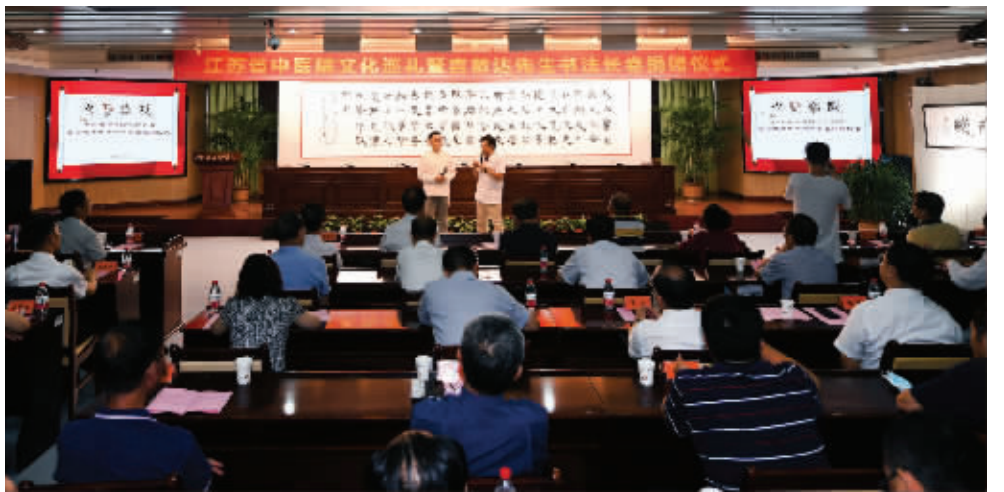
7月12日，江苏省中医院文化巡礼暨言恭达先生《大医精诚》书法长卷捐赠仪式在南京举行

今年，面对突如其来的新冠肺炎疫情，无数医护人员挺身而出，以大医精诚的精神挽救了无数患者的生命。7月12日，江苏省中医院（南京中医药大学附属医院）文化巡礼暨言恭达先生《大医精诚》书法长卷捐赠仪式在南京举行。清华大学教授、著名书法家言恭达先生创作的隶书书法长卷《大医精诚》节选和“大医精诚”金文书法横披，捐赠给江苏省中医院，致敬可敬可爱的白衣战士。