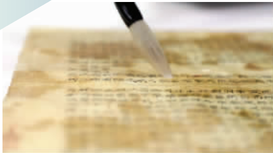
对酸化部分进行脱酸