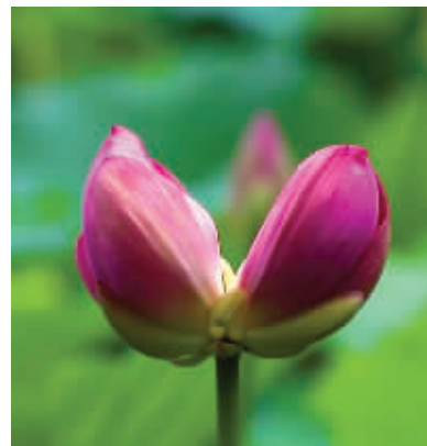
并蒂莲含苞待放

快报讯(记者 张然)“青荷盖绿水,芙蓉披红鲜。下有并根藕,上有并头莲。”7月12日,玄武湖荷花中再现罕见的并蒂莲,两个嫣红的花骨朵并蒂生长,亭亭玉立,吸引了不少游客打卡留念。