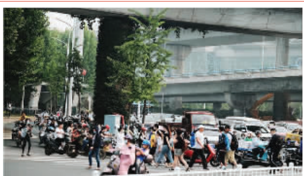
新庄广场日常人流量很大

新庄立交是南京玄武大道、红山路、玄武湖隧道、九华山隧道、龙蟠路等六条快速路、主干路的交会处,也是最让司机犯晕的地方之一。上有立交,下有环岛,每天车流量很大。因出口多,每个出口都设置了斑马线,红灯等待时间长,常常人车混行,有人横穿马路。近日,现代快报记者获悉,酝酿了6年之久的新庄立交地下人行通道终于要开建了,拟建一条Y字形地下通道,下穿玄武大道、红山路,将南林大、居民区和商业综合体串联起来,最快8月施工。